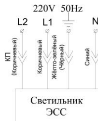
Светильник с аварийным режимом L1- основное питание L2- контроль присутствия U (подключать от эл. сети 220В фаза)