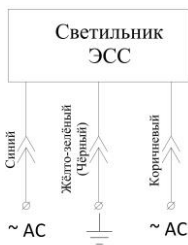
Переменный ток Светильник с аварийным режимом